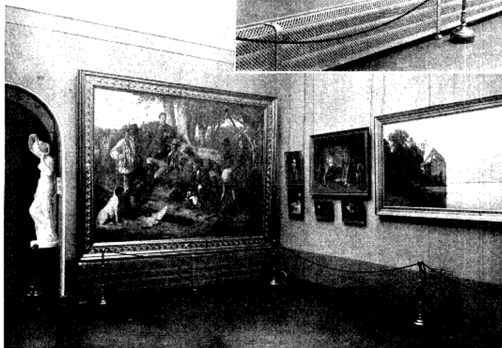
DEN LILLE SAL

træt af Datteren og Hobbemas »Vandmøllen«, der vil fange Interessen, alle fuldgode Repræsentanter for de Navne, der repræsenteres.